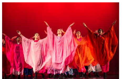
Езикът на идеите - говоримият език, Езикът на чувствата - музиката, Езикът на волята - евритмията. Рудолф Щайнер

"Основното в евритмията не е заложено в красотата на тялото, а в това да го ползваме като свършен и здрав инструмент. Ние позволяваме на цялото си същество, тяло и съзнание, да се проникне от звуците на словото и музиката, от цветовете, динамиката на правата и кривата линия, от жестовете на зодиака и планетите, така че нашият жест и пространството около нас да станат живи и изпълнени с елементите на евритмията."