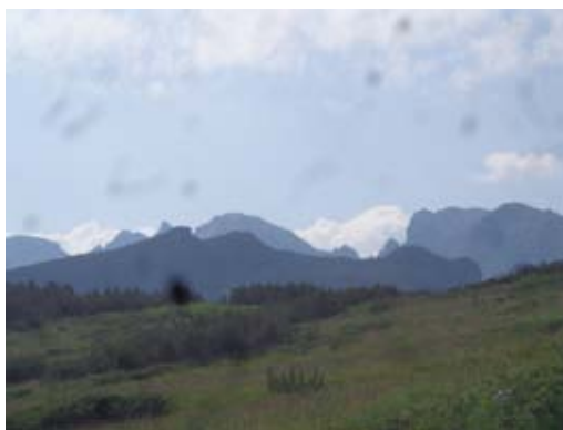
Рила

Философският смисъл на този интеркултурен размисъл върху земните координати на световната история се състои в защитата на водещата теза за примата на Духа в историята. За Хегел световната история е „дисциплиниране на необузданата естествена воля и нейното извисяване до всеобщото и свободата“. Но когато търси големите измерения на историята, Хегел същевременно се оказва и пленник на географската конкретност. В нейния обзор се полага структурата на философско-историческия размисъл, която се разгръща в четири непоследователни възрасти на историята: детство, незрялост, зрялост и умъдрена старост, а последователността на развитието е от изток на запад. В тази последователност, според Хегел, разумът реализира плановете си в историята.