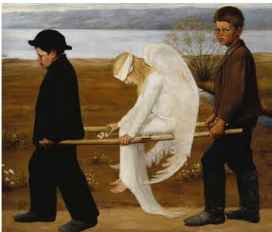
„Раненият ангел“ от Хюго Симберт (1873-1917)

„Христос ни познава. На една душа, която вижда Духовната наука в истинската светлина, на едно сърце, което чувства Духовната наука в истинското ѝ значение, не мога да предам по-езотерична мисъл от тази: Христос ни гледа.“