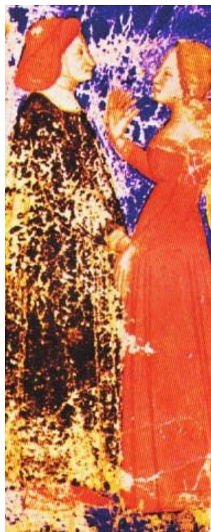
Фиг. 5: Данте и Беатриче (Италиански ръкопис от XIV век)

Осветяването на човешкото лице е възможно само защото божественото присъствие може да се види във всяко лице. Красотата, която се излъчва от човешкото лице, ни напомня за божествеността, обитаваща във всяко човешко същество. Поетът Данте отново и отново описва грейналата усмивка, озаряваща лицето на любимата му Беатриче, докато тя го води из небесните сфери. В нея той вижда преобразеното човешко същество. „Свещената усмивка, грейнала на свято лице“ за Данте е откровение на обожественото човешко същество.(15) Всеки от многобройните му опити да опише красотата в „Небе“ е пресъздаване на неопишувателна лъчезарност, изгряла на нейното лице. С любовта си към Беатриче, Данте става свидетел на присъщата святост на човешкото лице. (Фиг. 5)