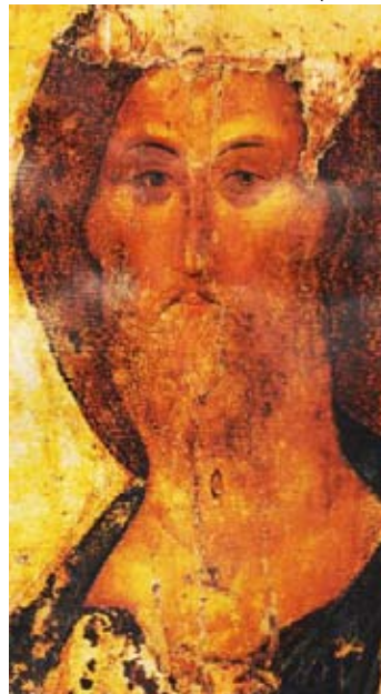
Фиг. 4: Икона на Христос от Сергей Рубльов, XV век

иконоборците, които се стремят да ги унищожат. Седмият събор решително легитимира изобразяването на лицето на Христос на „свещените икони“. Иконата е свещено изображение защото показва не само човечността на Христос, но и неговата божественост. (Фиг. 4)