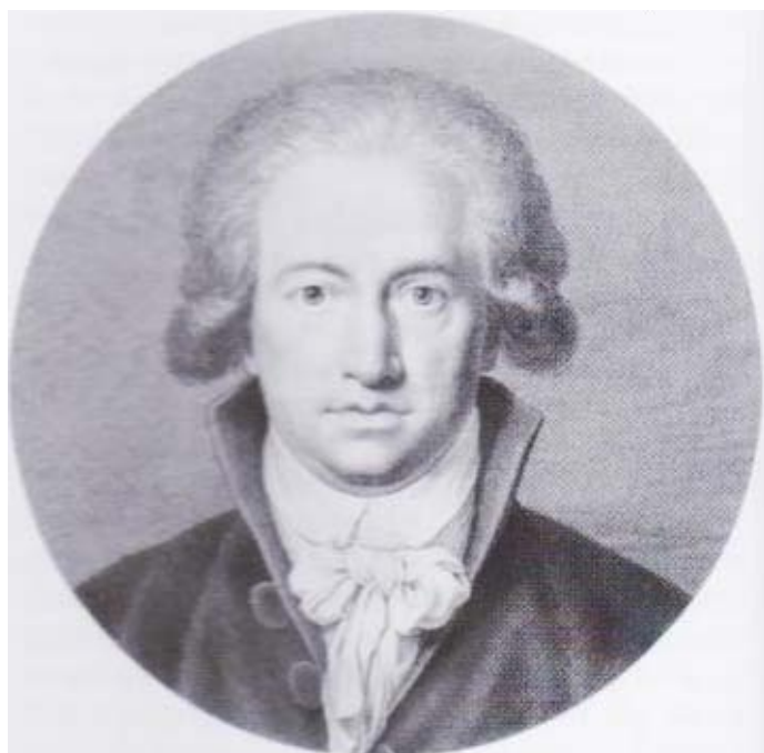
Фиг. 2: Гьоте на 42 години. Гравюра върху медна плочка

Затова разпознаваме някое животно, например местна катеричка, котката на съседа или елена на Фиг. 1 според неговата порода, големина и форма, както и отличителните белези по тялото му. От разстояние можем да различим и някое човешко същество по сходни индикации – цялостната му физика, начина, по който върви или дрехите, които носи. Но едва когато се приближим до него лицето му потвърждава кой е той или тя. Едва когато видим лицето на човека, чувстваме, че виждаме тъкмо него. Човекът в своята цялост присъства пред нас с лицето си. Лицето принадлежи единствено на него и изразява неговата неповторимост, както например непосредствено познаваемото открито лице на Гьоте. (Фиг. 2)