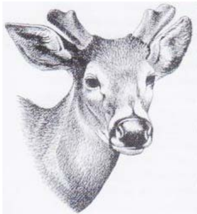
Фиг. 1: Белоопашат елен

по-малко фиксирано изражение. Затова не можем да говорим за лице или образ при животните в истинския смисъл на думата: само човешкото същество има лице.(3) Муцуната не изразява индивидуалност по същия начин, както човешкото лице, а остава свързана със силите на наследствеността и „груповата душа“ на вида, към който принадлежи съответно то животно. (Фиг. 1)