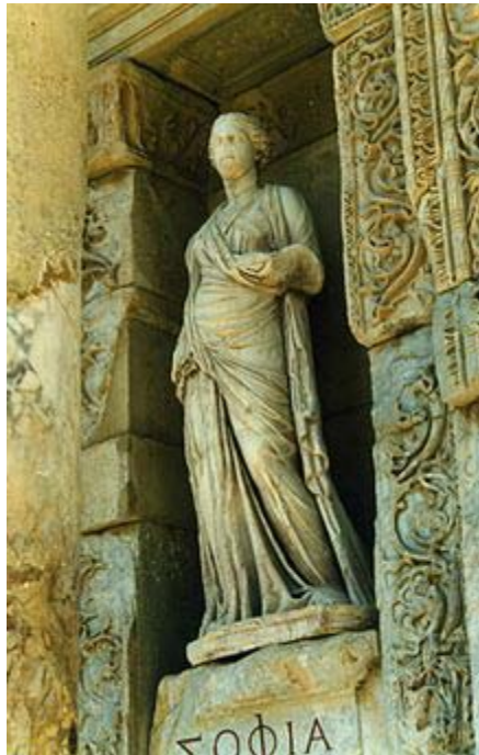
Статуя на Мъдростта София – библиотека на Целз в Ефес

- Електронните книги не допускат до себе си пластичната сила на моето мислене.