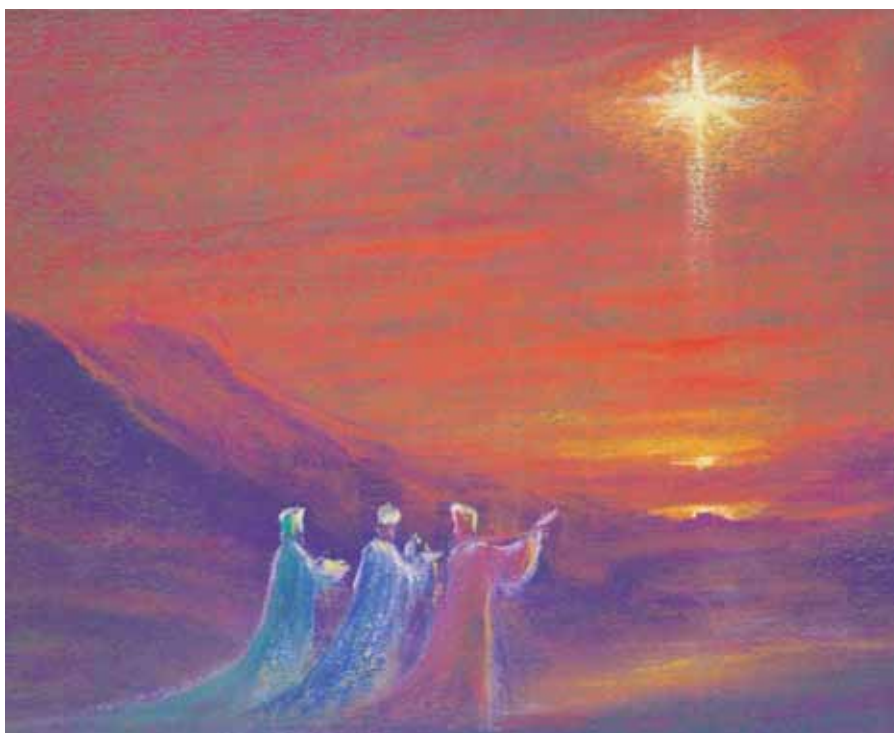
„Витлеемска звезда” – Дейвид Нюбат

„Де е родилият се Цар Юдейски? Защото видяхме звездата Му на изток и дойдохме да Му се поклоним.”