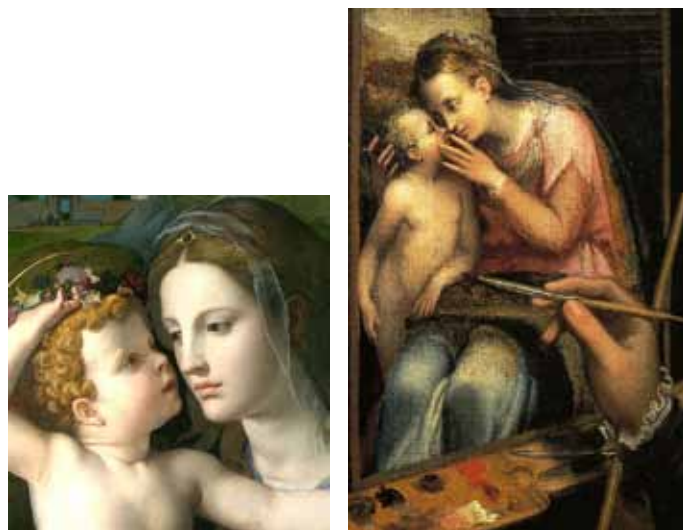
Фиг. 3 и 4

Примери за това са показани на фиг. 2, 3 и 4. На третата съвсем близко разположените топли очи на двете фигури се сливат в едно, давайки израз на сродни души. Вероятно именно това искат да предадат древните майстори – подобие на душите на мадоната и детето! Тези на първата сякаш искат да кажат нещо на детето, което то с готовност приема! Отдолу личи ръката на художничката, докосваща с четката ръката на детето – италианката Софонизба Ангисола.