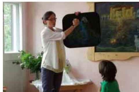
Открит урок за първи клас в детска школа „Изида“

3 Изразът включва човека с неговите физическо тяло, душевни и духовни тела.