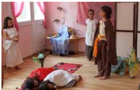
Театрална постановка „Белоснежка и Червенорозка“ в детска школа „Изида“