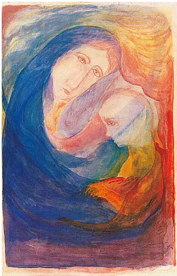
Рудолф Щайнер – „Майка и дете” – акварел, 1924

Човекът върви към бъдеще, когато духовната светлина ще проблисне от вътрешността му и ще заблести в целия свят. Това трябва да прозвучи в душите ни по времето на Коледния празник. Тогава ще можем да празнуваме Рождеството като празник в името на най-висшия идеал на човечеството, а Свещената нощ ще породи в душата ни радостната сигурност: „Да, и аз ще изживея в себе си това, което трябва да се нарече раждането на висшия човек и в мен ще се извърши раждането на Спасителя, раждането на Христос.”