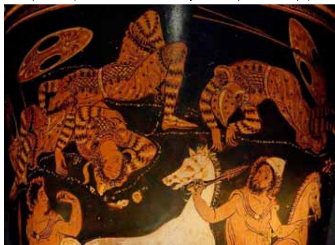
Фиг. 2. Отвличането на тракийските коне, детайл от сцена върху древногръцка ваза

Най-вероятно именно заради специфичното им изоставане от другите народи, в десета песен на „Илиада“ Омир казва за траките, че „стануват последни от всички“ във военния лагер на съюзническите войски на троянците. На тях единствено е отделена цяла глава, която е ключова, а описанието им има приказен, трудно разбираем характер. Особено забележителна е тяхната съдба да бъдат избити още в нощта на пристигането, и то само от двама противници – гърците Одисей и Диомед. (Фиг. 2) Истинската цел на последните е отвличането на тракийските снежнобели коне, което обръща хода на войната, която, както е известно, се явява преход между Третата (египетско-халдейска) и Четвъртата (гръцко-латинска) културна епоха. Ключът за това е в тракийските коне, които са образ на интелектуалните сили на зараждащата се Разсъдъчна душа на древните гърци.