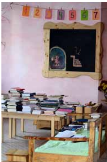
Сортиране на дарените книги по азбучен ред

През януари 2017 г. обявихме първите занимания в детска школа „Изида“. Оттогава има постоянна „група за игра“ за децата до 7-годишна възраст, сезонни и празнични работилници, социална арт терапия. До лятото имаше школа по театър за учениците от първи и втори клас, а днес вече и евритмия.