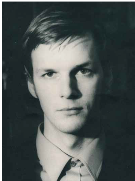
Сергей Прокофиев - Москва, 1982 г.

Сергей Прокофиев е само на 28 години, когато книгата му излиза, и несъмнено е хранил големи надежди за нея –