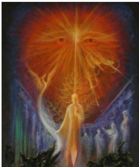
Архангел Михаил – Дейвид Нюбат

сфери в човешкото царство, за да опази недокоснатата от Луцифер една част от първичната човешка субстанция. От тогава до днес Михаил я съхранява в духовните светове като едно небесно подобие на човека. Едно по-късно негово участие в еволюцията е изживяването на Мистерията на Голгота от Слънцето и преместването на духовния център на нашата космическа система от Слънцето на Земята. Управляваната от Михаил космическа интелигентност последователно е била спусната по същия път, по който Христос е слязъл на Земята от Слънчевата сфера. От тогава космическата интелигентност постепенно започва да става човешка, а в своите души хората все повече се изживяват като творци на собствените си мисли. Днес съдбата на Михаилевата интелигентност повече от всякога се намира в човешките ръце, защото докато в човешките души се полагат основите на свободата, нараства опасността интелигентността да пострада, като остане в плен на Ариман. Тъй като в епохата на Съзнателната душа човечеството трябва да направи своя избор между Михаил и Ариман, за да му помогне, Миха-