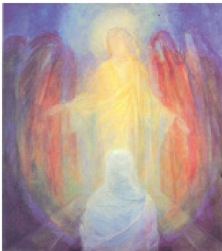
Юда и Етерният Христос – Дик Чини

Азурите, които винаги действат против развитието, се опитват да унищожат аза, но тъй като не могат да постигнат това, те унищожават резултатите от многото инкарнации. Азурите работят за анти-развитието, като отрязват резултатите от различните инкарнации. А съществата от йерархията на архаите подкрепят развитието и го освобождават. Това е тяхната изначал-