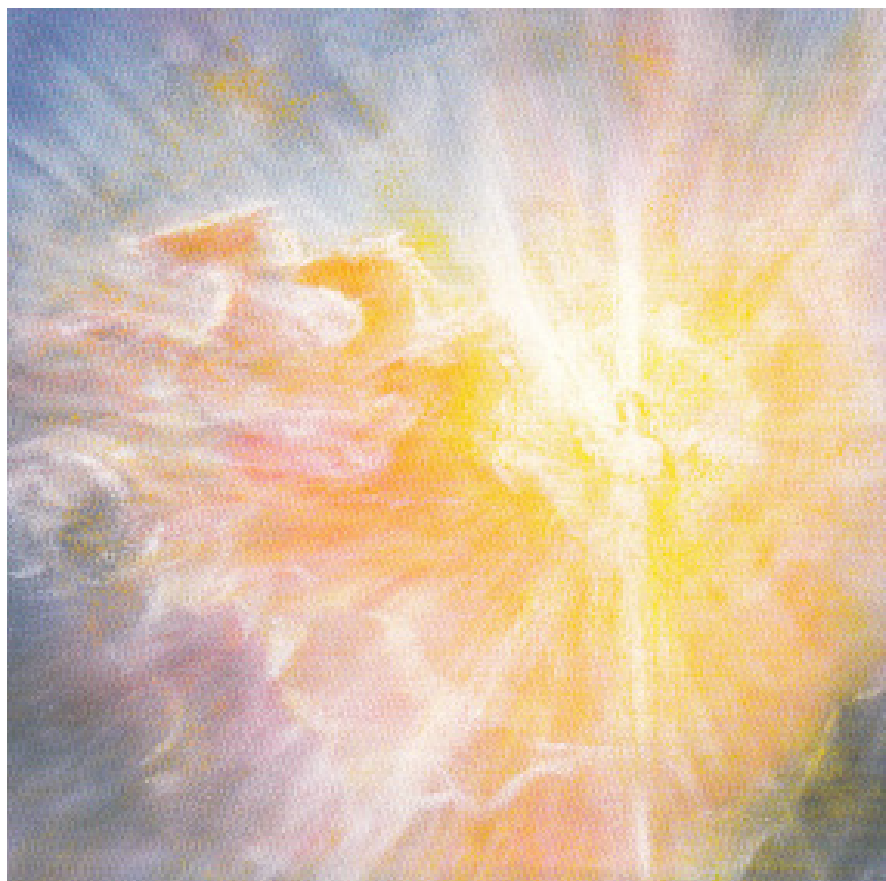
Михаил с небесната колесница – Дейвид Нюбат

Епохата на Михаил, който побеждава дракона, трябва да започне, защото силата на дракона е станала огромна!