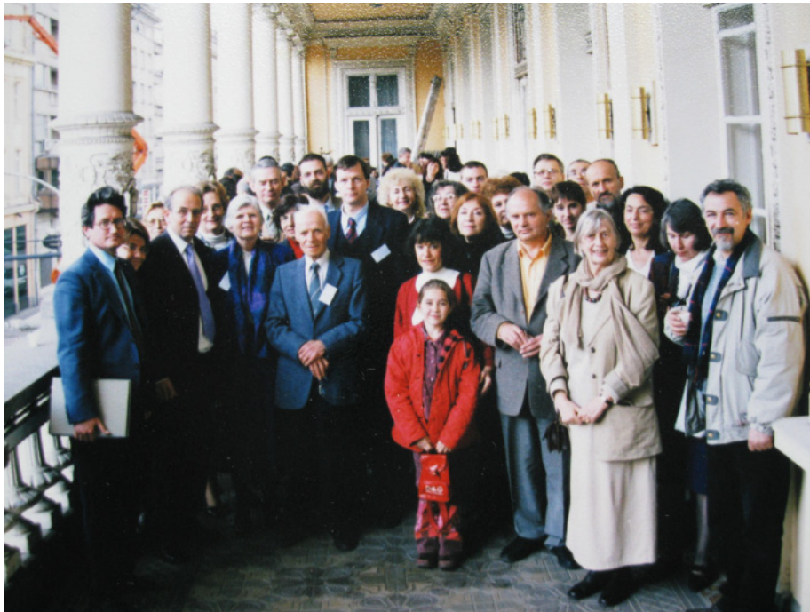
Първата конференция на АОБ през 2002г.

и изпитания, които неизбежно възникват и ще възникват в нашия общ път“. А в последното писмо, което получих от него през януари 2010 г., той изказва трогателно и мило своята благодарност за превода на втората книга и отправя своето коледно пожелание: „От цялото си сърце пожелавам на вас и на всички антропософски приятели в България спокойна и задълбочена духовна работа през