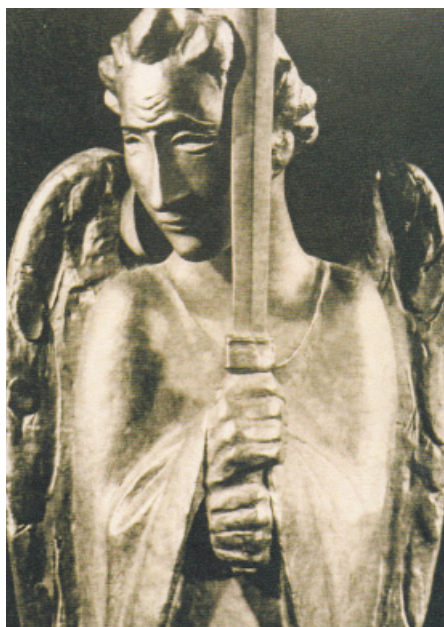
Духовен воин – Ернст Барлах

„Един ден, Рудолф Щайнер ми разкри как анти-Михайловите демони правят необуздани и безразсъдни опити да попречат на Михайловите дела, да не им дадат възможност да се проявят и да ги разрушат. Демоните крият своите намерения и само хората могат да изтръгнат тези тайни от тях. Единствено хората могат да получат познание за тайните на демоните. Боговете очакват тези тайни, които хората ще им занесат, и само боговете на свой ред могат да разгадаят и разрешат тези загадки за хората. Само чрез такъв жертвен дар, поднесен от хората на боговете – мистериите изтръгнати от демоните – могат да се предотвратят тъмните зловещи