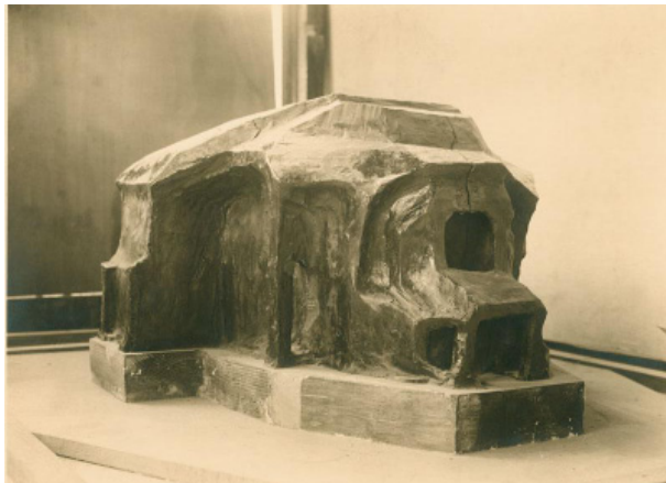
Макет от Р. Щайнер на втория Гьотеанум, март 1924 Червено-кафяв Харбътски пластилин, мащаб 1:100

Днес Гьотеанумът не е боядисан отвън (или оцветен по друг начин). Цветът му е цветът на бетона. И все пак, никога не е било планирано той да остане сурова бетонна сграда. Общото икономическо положение преди, както и по време на Втората световна война, са позволявали само най-необходимите неща. Малко след войната, фасадата на Гьотеанума е обявена за исторически паметник. В резултат от това, външният му вид е юридически дълбоко замразен в своето незавършено състояние. Дълго време съществува едно състояние на безпомощност във връзка с намерението на Рудолф Щайнер да боядиса Гьотеанума. С намирането