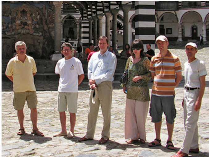
В Рилския манастир, 2007 г.

Показателна е неговата човечност при друг един случай. Един близък антропософ маниакално си беше внушил нещо във връзка с Прокофиев и аз трябваше да го заведа с колата до Сакраменто на 600 км от Лос Анджелис, където