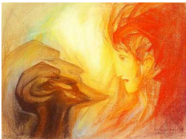
Луцифер и Ариман – пастел, Рудолф Щайнер

Може да се каже още: едно Обществото „с човешки облик” е общество, което работи с благоговение, състрадание и съвест. В този контекст съвест означава връзката между силата на проникновението и разбирането (познанието), и морала. Да имаш чиста съвест и да действаш с чиста съвест в този смисъл означава да не изменяш на собствената си степен на разбиране и познание. Благоговението, състраданието и съвестта, определени от Щайнер като трите ка-