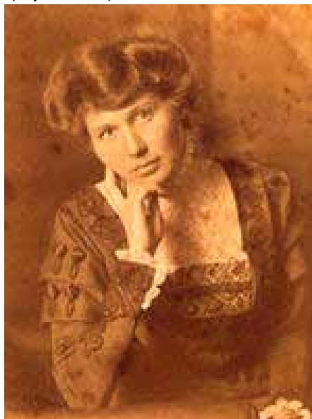
Ита Вегман, 1910 по време на обучението си в Цюрих.

път, но и всички други, като свободно следват ветровете или напредват срещу по-дълбоки морски потоци. Ако не внасяме никакви оценъчни или псевдо-окултни интерпретации, това сравнение може да ни помогне да погледнем в самата същност на езотеричната задача на първото управление. Защото обединението на огъня и водата – което в този случай е