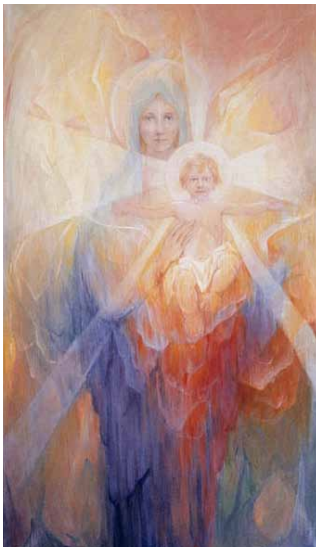
„Мария“ – Арилд Розенкранц

Да разбудим в себе си Коледната светлина и тогава тя ще се яви не само на нас, но и на нашите братя човеци, които са с нас във в света. Човечеството се нуждае от нова прокламация, а най-дълбоките неща в човека - от възобновен призив. Тогава и само тогава ще сме достойни да кажем: Спасителят се роди в нас.