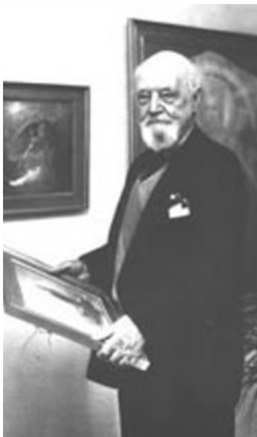
Портрет на А.Розенкранц

Арилд Розенкранц умира на 28 септември 1964 г.